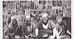
映画「バンク・シンドローム」

FAX 03-3511-7031 E-mail: imagesatellite@hotmail.com