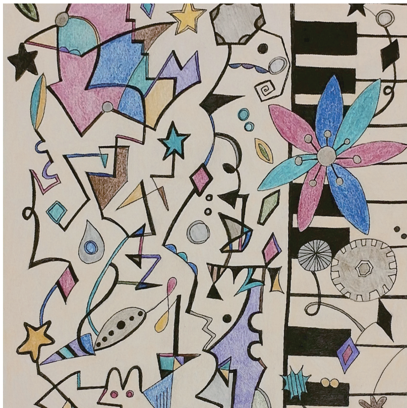
ピアノのメロディー