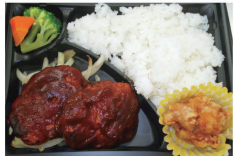
ふくふく亭特製日替り弁当

野菜の袋詰め作業の他にも、試供品の袋詰めや廃油の回収、油こし作業、米卸問屋の簡易清掃作業などがあります。