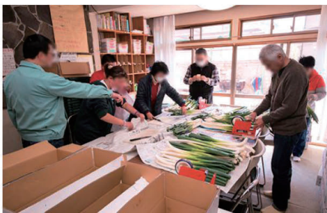
新鮮野菜の袋詰め作業(旧ひだまり)

宇都宮市に事業所を構える「ほっとスペースひだまり」は、就労支援B型事業西川田ひだまりと就労支援B型事業ふくふく亭。そして、男性専用グループホーム(メゾンドノエル)で構成されています。