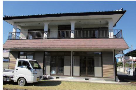
新しい西川田ひだまり

をスローガンに、障害福祉サービスを通して、精神障がいを持つ人が地域で暮らしていくための支援を行っています。