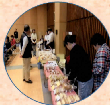
作業所自主製品展示会