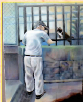
平成27年、展示作品の特別賞・奨励賞を受賞した作品

心の美術展は当事者が書いた絵画や書道などの作品をロビーで展示します。また、作業所で作製した自主製品の展示会を行います。