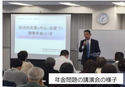
年金問題の講演会の様子

疾病や治療、福祉制度等に関する学習会、家族相談をするための技能の向上を目指した研修などを、支援しています。