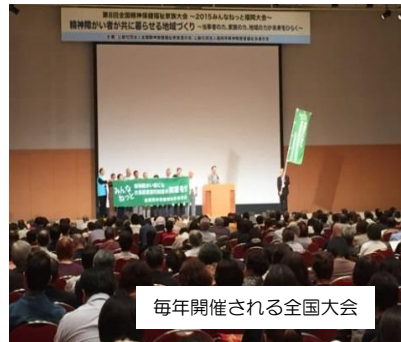
毎年開催される全国大会

全国の家族が一堂に集まる、全国大会を開催しています。また医療や福祉等をテーマとしたシンポジウムを開催し、多くの家族・関係者・地域の人が意見を交わし、病気や障がいへの理解を深めるようにしています。