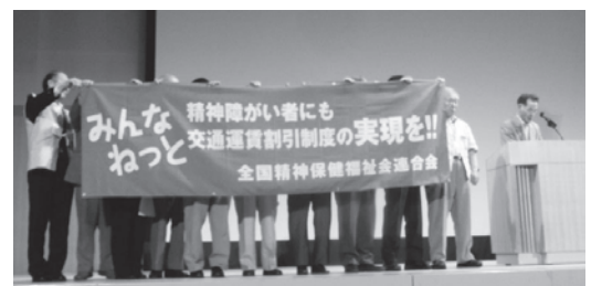
署名協力要請の横断幕

更に、今後の具体的な行動提起として「他障害と同等の交通運賃割引を求める署名運動のよびかけ」が行われました。最後に次回開催の三重県家族会代表による挨拶があり、主催者の閉会の言葉と共に2日間の大会が終了しました。