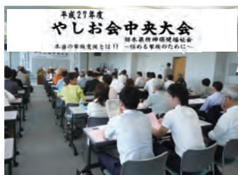
皆さんの熱気が伝わってきます

発行所：〒329-1104 宇都宮市下岡本町2145-13 栃木県精神保健福祉センター内 栃木県精神保健福祉会（通称やしお会） TEL 028 (673) 8404 FAX 028 (673) 8441 メールアドレス yashio@lime.ocn.ne.jp