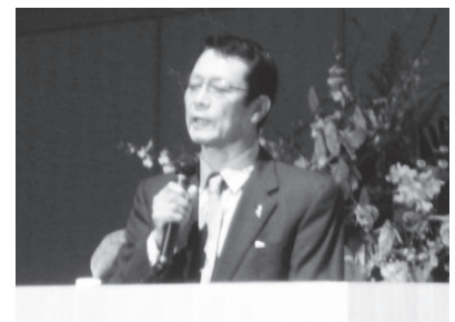
講演される藤井克徳氏

【基調講演】 開会式の後には、13:00から「戦後70年と障害者権利条約」～精神障がい者施策の課題と展望～ と題して、日本障害フォーラム(JDF)幹事会議長 藤井克徳氏による基調講演がありました。藤井氏は、長年に亘り日本の障害者施策に提言を続けて来られ、8月に放送されたNHK番組ハートネットTVシリーズ戦後70年「障害者と戦争」でもレポーターとしてドイツを訪問し、戦時中ナチスによって20万人もの障害者が虐殺された歴史の事実を伝えられました。そして2006年12月6日第61回国連総会における障害者権利条約の採択に尽力され、わが国では昨年1月批准されました。講演では、権利条約制定の背景と経緯、権利条約の特徴と意味、今後の課題についてのお話があり、家族会の役割は先ず集まる事。集まるからエネルギーが生まれる。そして学ぶこと。新しい関係性を作るために動くこと。ひとくりにしないで、一人一人の家族に対して向き合う事。「過去と他人は変えられないが、未来と自分は変えられる」を信じて次の5つの事を心に留めて活用し、家族会を続けてほしい。」と締めくくられました。