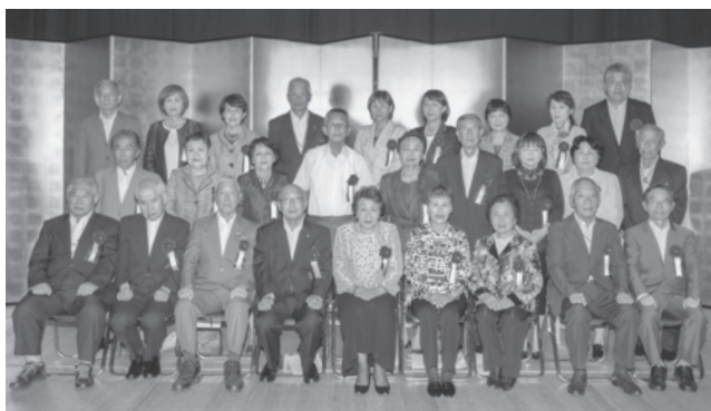
みんな揃っての記念撮影（前列左端が興野会長）