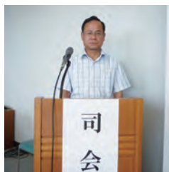
司会をする大越理事