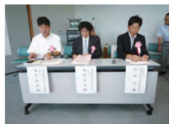
来賓の方々に温かい励ましの お言葉をいただきました

日時：平成 27 年 7 月 10 日(金) 場所：宇都宮市保健所 参加者：108 名