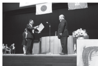
代表して表彰状を受け取る興野会長