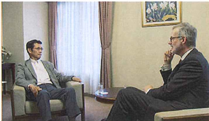
長年の沈黙を破ったドイツ精神医学精神療法神経学会会長と対談

http://www.nhk.or.jp/hearttv-blog/3500/225574.html#comment