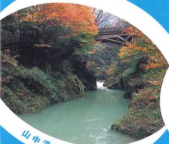
山中温泉・こおろぎ橋