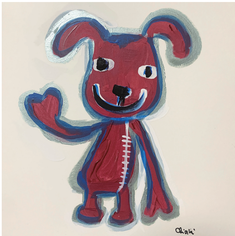
赤いわんこ チアキ